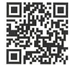
受付専用フォーム